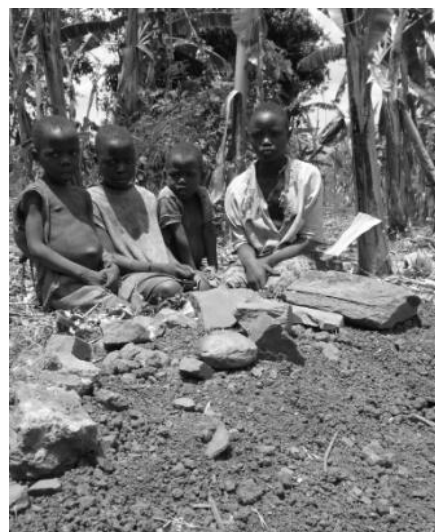
子ども家長世帯、両親のお墓のまゝで

※ MUKWANO とはウガンダ共和国現地語ガンダ語で「親しい友・愛する友」という意味です。ウガンダ共和国ラ