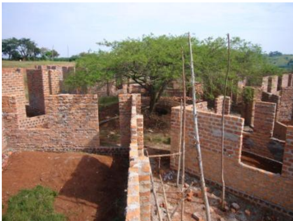
第一期工事完了、一本の木を中心に7棟の建物が並びます

済情勢の変化による物価高騰などの影響を受け、建設見積もり額を修正せざるをえなくなりました(最終総工費 4,300,000 円になる見通し)。