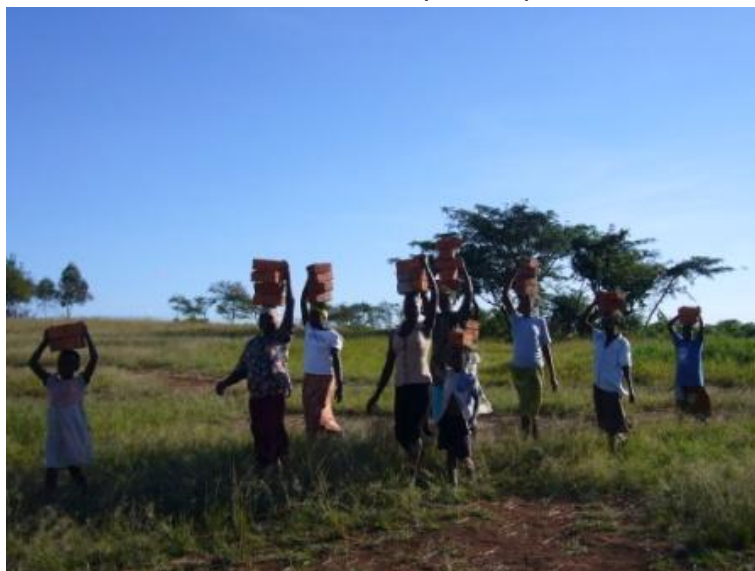
サマニャの子どもたちもレンガ運び

2007年5月12日、ウガンダ共和国ラカイ県ルワマグワ郡において、エイズ遺児のための孤児院・職業訓練所の建設を開始しました。工事は順調に進み、6月末に第一期工事、8月末に第二期工事が完了、現在、第三期工事に入っています。ただ、現場において資材不足、ウガンダ国内の経